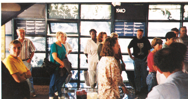
Överst: En "glasfågel" svävade ovanför våra huvuden när vi trädde in i glasmuseet i Riihimäki.

Underhållningspatrullen längst bak i bussen var uttröttlig och stämningen var överlag mycket god. Det skämtades friskt under resans gång, inte minst om vad som skulle komma i nästa nummer av tidningen. Men redaktören är en överseende person så vi nöjer oss väl med att tacka dem som jobbat med förberedelserna för resan och hoppas att fler får turen att resa ett annat år.