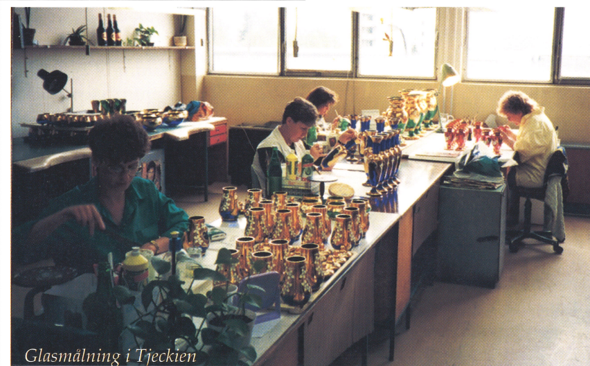
Glasmålning i Tjeckien