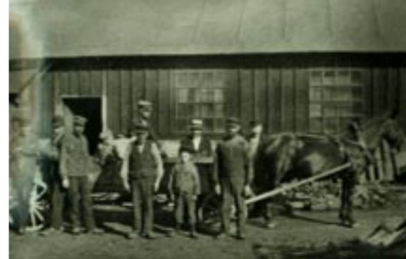
Gustafsströms gjuteri; en del av personerna som tillverkade de många vackra och värmande kokspisar (vedspisar) som värmt så många kök i den här delen av Småland. Idag finns platsen och grundstenarna kvar från denna en gång så omfattande industriverksamhet.

Här låg Kristinebergs garveri. De utnyttjade både vattenkraften och vatten till blötläggning