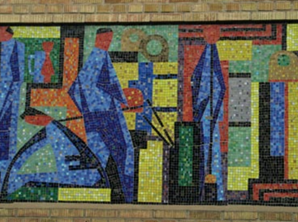
Detalj från mosaiken "hyttarbetare".