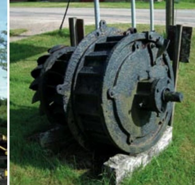
Tv den gamla kvarnbyggnaden.