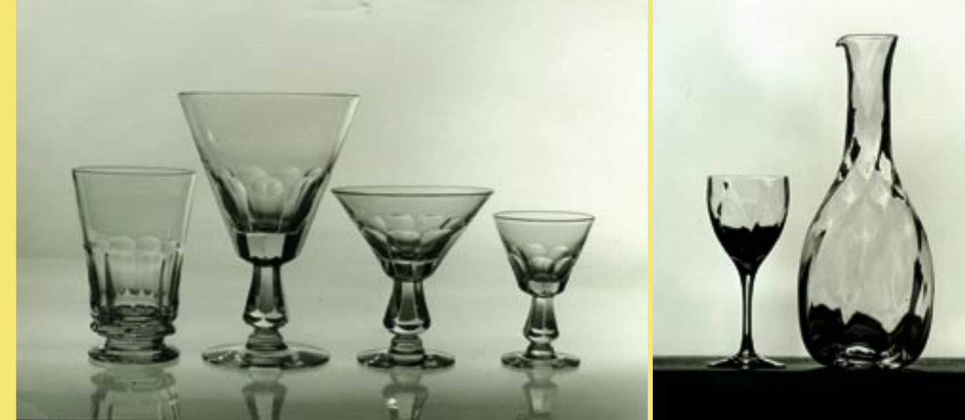
Tv Fasett, slipat glas. Th Chateau-glas och karaff.

1991 skulle glasbruket fira 100-årsjubileum. I stället lades glasbruket ned av Orrefors Kosta Boda-koncernen som då stod som ägare. Av 100-årsjubileet blev det ingenting. Glasbruket togs över av glasarbetare och bytte ägare flera gånger fram till 1997. Sedan mars 1997 ägs Jo-