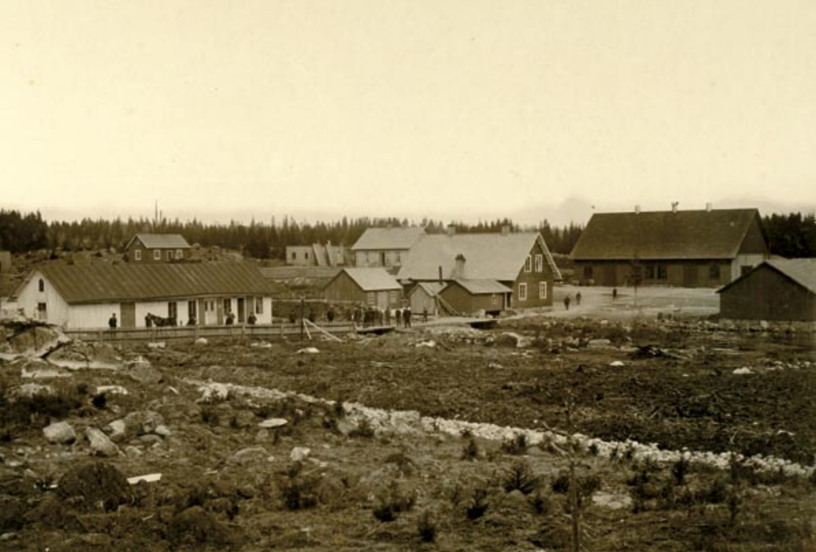
Den äldsta kända bilden av Johansfors – Från 1890-talet. Den vita låga byggnaden till vänster är det f d mejeriet vid ån (vattnet syns ej i bilden) som 1889 blev glasbrukets måleri. Den största byggnaden längst bort th är hyttan byggd i trä. Den låg på exakt samma plats som dagens hytta. Den raka bruksgatan har redan anlagts.