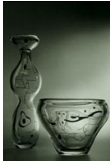
Målat glas från 1950-tal.