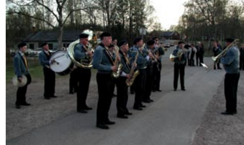
Johansfors musikkår Valborgsmässoafton 2004.