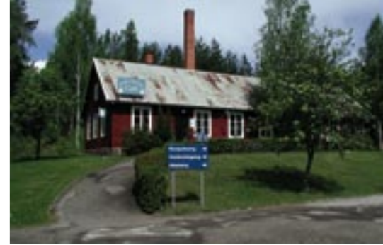
Det gamla glasmåleriet används idag som café.

De två brännugnarna eldades med ved. Brännugnar och skorsten finns kvar idag, men byggnaden används i stället till café sommartid. Välkommen in! Här kan du också köpa matsäck att ta med på en av de promenader eller cykelturer du kan göra runt i omgivningarna.