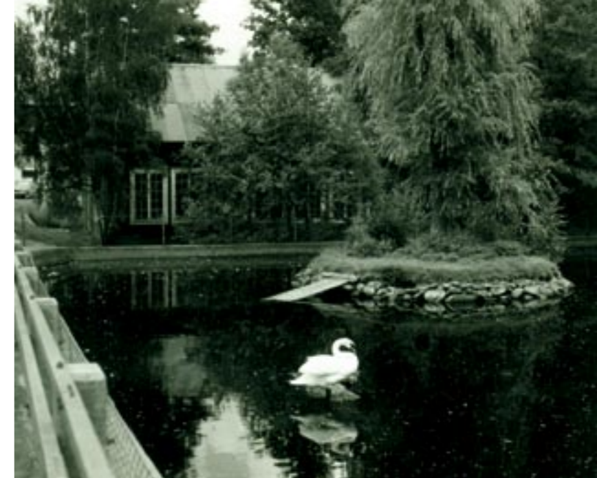
Svandammen på 1950-talet.

Nästa disponentvilla (19b) tillkom lite senare, i början av 1900-talet, i tidstypisk stil inspirerad av schweizerstilen. Det var disponent Oskar Håkansson och hans fru Anna – som var dotter till patron – som lät uppföra denna ståtliga ståndsmässiga villa med tinnar och torn. Den är typisk för disponentvillor: Placerad lite högt i en backe, för sig själv men ändå med utblick och ganska nära glasbruket, betydligt mer påkostat och storslaget än övriga hus på bruksorten. Märkligt med placeringen av huset är att bygränsen mellan Broakulla och Sutarekulla går rakt igenom tomten, så att huset kom att ligga i båda byarna. Eftersom tjänstefolkets rum låg i ena sidan av huset blev i prästens papper herrskapet skrivna (folkbokförda) i Sutarekulla och tjänstefolket i Broakulla! I dag privatbostad.