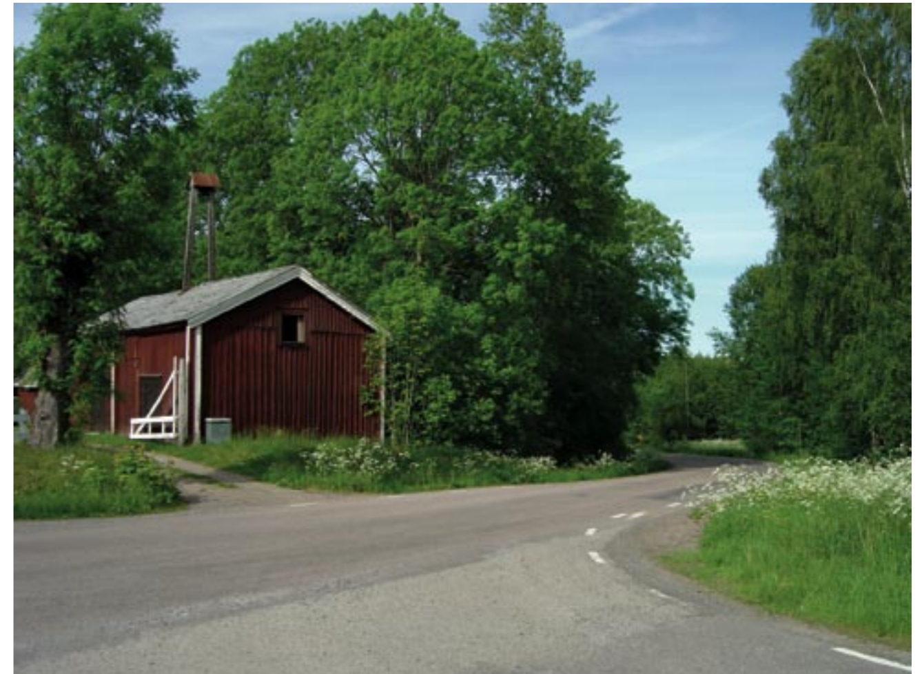
Vid Bidalite vägskäl har det legat gästgiveri sedan 1600-talet.