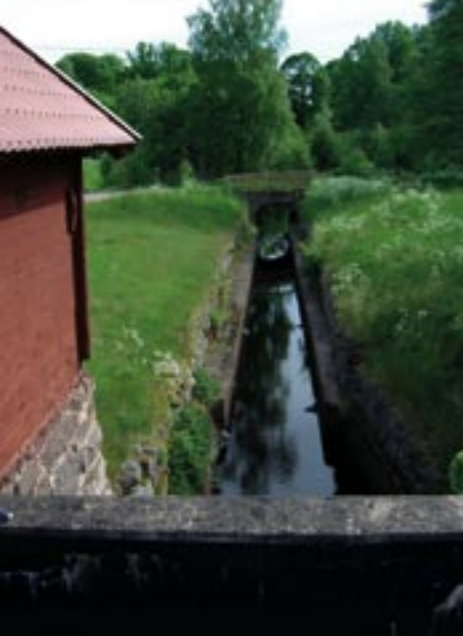
Elverket från 1914 och vattenrännan.