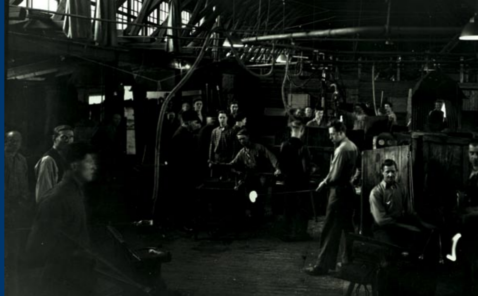
Glasarbetare i gamla trähyttan, Johansfors glasbruk, tidigt 1900-tal.

Bok av Vilhelm Moberg: Rid i natt Liv och arbete under 90 år vid Johansfors