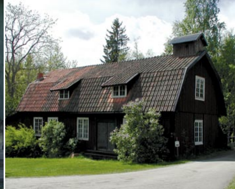
Sutarekulla kvarn och den vackra entrédörren.