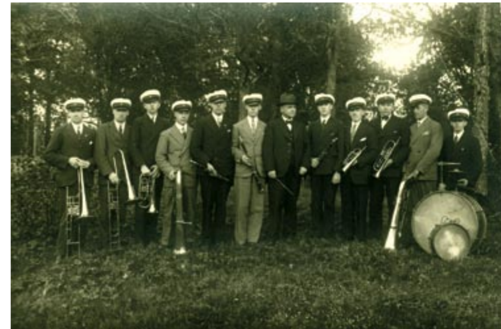
Johansfors Musikkår, årtal okänt.

Så slutar denna vandring med ännu en fabrik som likt glasbruket har sitt ursprung vid Lyckebåns vatten!