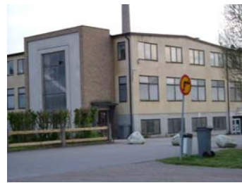
1. Johansfors 2. Lindshammar 3. Skruf