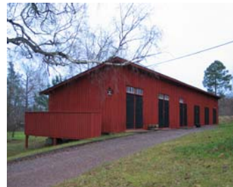
1. Kosta 2-3. Orrefors