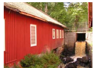
Exempel på vattenkraftens betydele i Glasriket.

Förutsättningar att göra en egen guideskrift om Strömbergshyttan är dock gynnsamma eftersom det är en samlad och kulturhistoriskt intressant miljö. Fakta finns att få från länsstyrelsen i Växjö, Smålands museum och böcker så att ett sådant delprojekt mycket väl kan göras. Det är ett önskemål att under en etapp III göra en guideskrift också över Strömbergshyttan i samma serie som de nu befintliga 11.