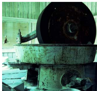
1-2. Boda. 3. Sandvik Hovmantorp. 4. Skruf 5. Pukeberg