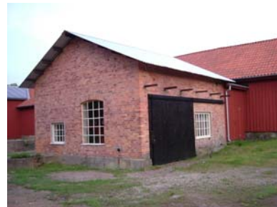
1. Boda 2. Skruf