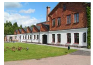
Ett av få sågtandade tak i Glasriket. Fd sliperi idag skola.