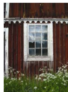
Åfors bruksladugård; en av få bevarade i Glasriket. Nu finns en arbetsgrupp som jobbar med renovering och nya användningssätt.