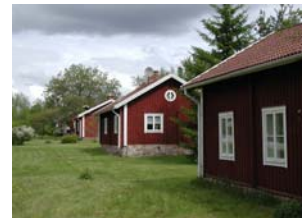
Arbetarbostäder från ca 1810 för fyra familjer.