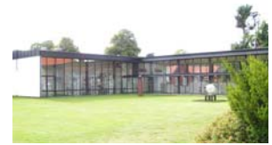
Utställningshallen, modern arkitektur från 1950-talet.

Den arbetsgrupp som funnits har varit mycket aktiv och kunnig vilket behövs för att ta fram information till guideskriften. I en ny fas nu behövs tydligare och bättre samordning med t ex turistinriktade näringsidkare för att kunna genomföra idéer och förändringar, utbildning och kontinuerliga träffar.