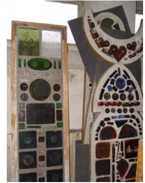
Glas av Erik Höglund