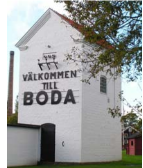
Transformatorstationen välkomnar idag.