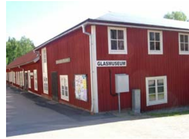
1. Bergdala. 2. Boda. 3. Skruf