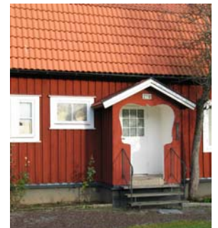
Arbetarbostäder i nationalromantisk stil