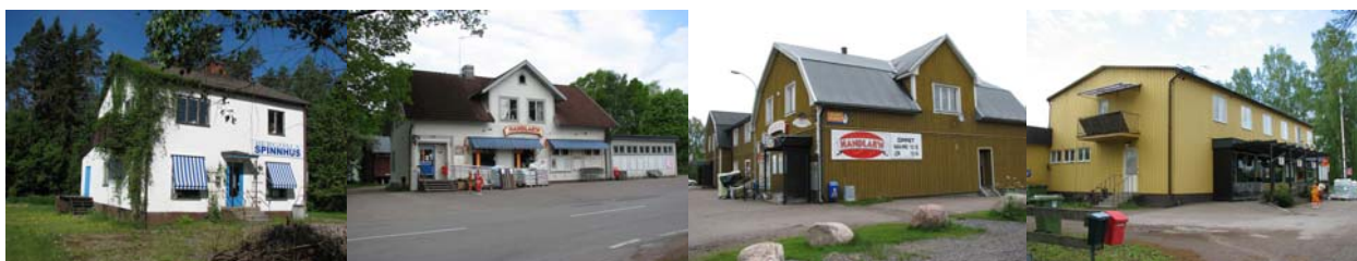
1. Bergdala 2. Johansfors 3. Målerås 4. Orrefors

I Kosta finns tre bevarade Konsumbyggnader: "Gamla Fenix" från 1916, nu om- och tillbyggd färgaffär, blomsterhandel mm, en tidstypisk tegelbyggnad som var filial i Fjällboda från 1953 och nuvarande butiken som togs i bruk 1973.