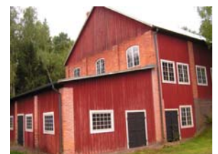
Det unika sodamagasinet med egen degelkross.