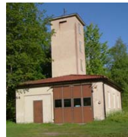
Brandstationen i Målerås är exempel på en annan typ av byggnad som bruket uppförde.