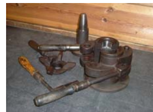
Bevarade gjutformar i gjutjärn.