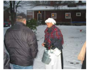
”Pigan Lotten från herrgården”. Upplevelseguidning i Kosta.