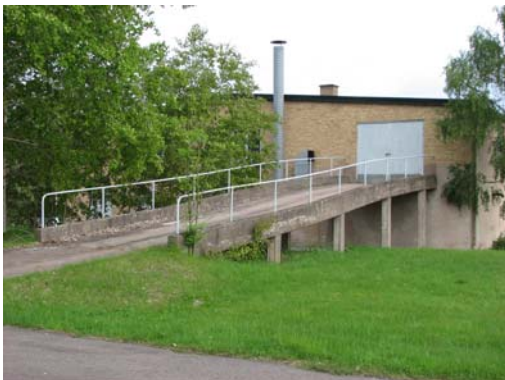
1-2. Johansfors. 3. Skruf 4. Johansfors bilramp till sandförådet.