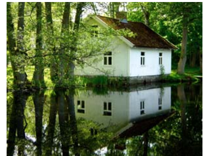
Åfors, mjölkbod och bruksladugård

I Rosdala finns två bruksgårdar som bruket förr ägde. I Kosta finns en stor sädeslada kvar (men ej ladugården) från jordbrukets epok, liksom arrendatorsbostaden. Ett område som var handelsträdgård finns kvar liksom delar av växthus och trädgårdsmästarens bostadshus. I Boda finns mangårdsbyggnaden kvar från det försvunna jordbruket. Det är en stor byggnad, kallad Vita byggnaden (men är idag röd) vilken flyttades hit från Förlångskvarn 1864 när bruket startade. I Orrefors heter hyreshusen från 1967 "Stallgården" som ett minne av stallar och lador som fanns här. Äppelträdgården var också en del av odlingsmark som gav produkter till brukets chef och anställda.