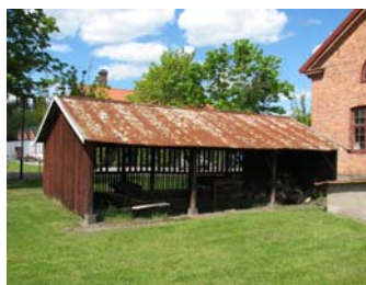
4. Åfors 5-6 Pukeberg (den andra cykelskjul för glasarbetarnas cyklar)