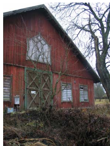
1.. "Stallgården" i Orrefors 2-3. Sädesladan i Kosta.

Orter där bruket sedan länge är nedlagt som ändå har kvar byggnader från bruksjordbruket: