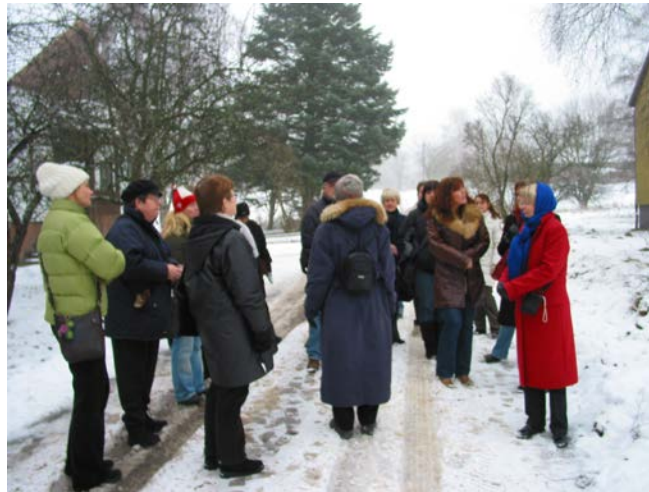
Guidad tur i glasbruksmiljö för arbetsgrupperna. Stormöte i Kosta December 2005.