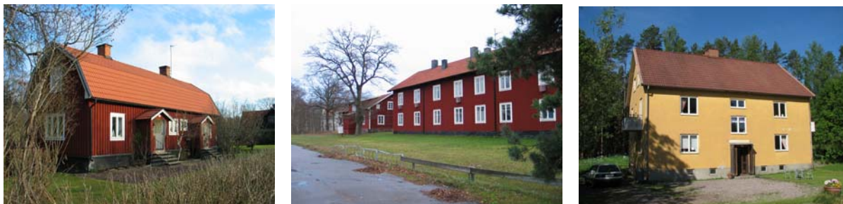
1-2 Orrefors 3. Bergdala

Orrefors: Har många bevarade fina arbetarbostäder! Exempel: Låga tvåfamiljshus med karaktäristiska verandor i nationalromantisk stil uppförda i samband med glasbrukets anläggande 1898, tre små flerfamiljshus uppförda för smederna under järnbruksepoken, flera stora kaserner, för många familjer och ungarlar, med namn som Fästampen, Snokaboet, Backabyggnaden, Kalvahagen, Betlehem, Jerusalem mfl.