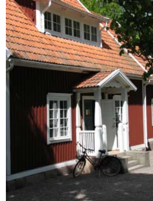
1-2 Kosta 3. Pukeberg