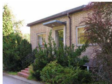
1. Orrefors huvudkontor ombyggt 1917 i en äldre byggnad, renoverat på 1950-talet. 2. Boda byggt på 1890-talet, ombyggt ca 1960. Båda har kulturhistoriska värden i de tillägg som gjordes på 1950- och 1960-talen. De är också symboliskt viktiga. 3. Lindshammar, byggt 1955.