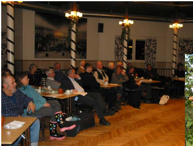
Stormöte i Kosta Folkets Hus.