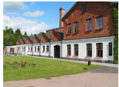
Fd sliperiet i Pukeberg