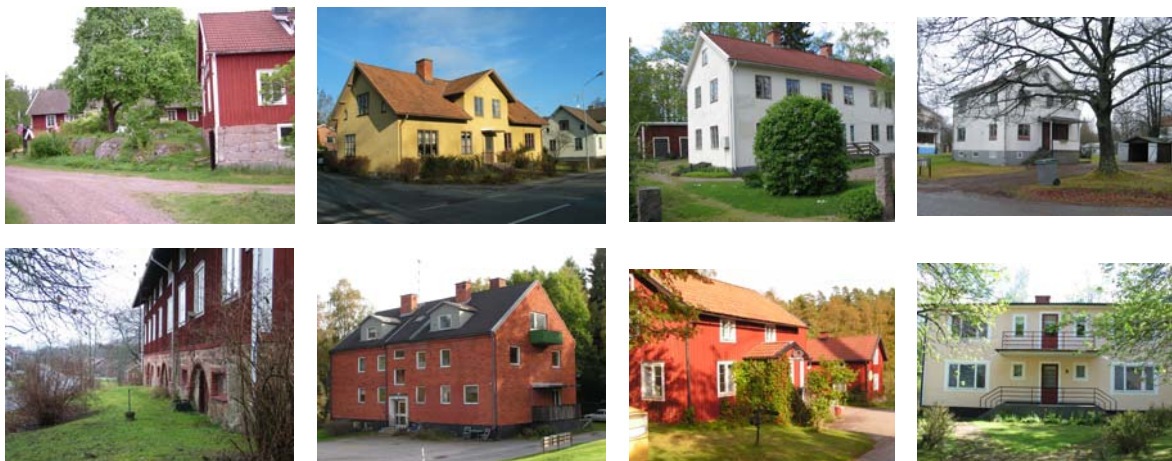
1. Bergdala. 2. Johansfors 3. Pukeberg 4-5. Kosta 6-7 Lindshammar 8. Målerås