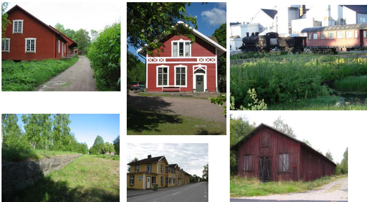
4. Orrefors godsmagasin. 5-7 Målerås 8.f.d Järnvägshotell Målerås 9. Kosta (Magasinet Långholmen)