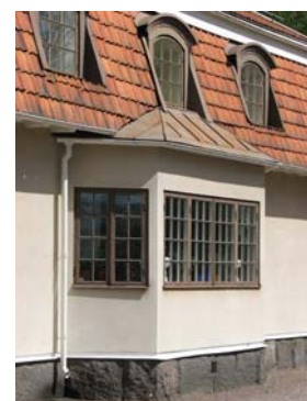
1. Bergdala 2. Pukeberg

Även orter där bruket sedan länge är nedlagt har ofta kvar den fd disponentvillan, t ex: