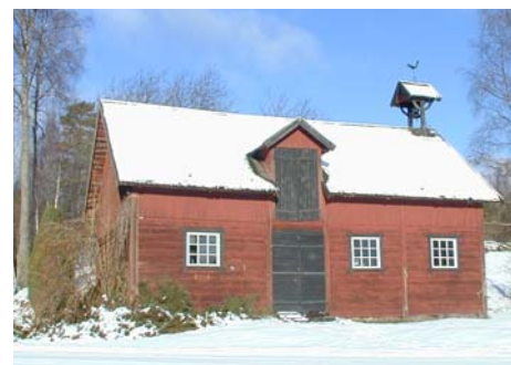
1. Bergdala 2. Pukeberg 3. Lindshammar