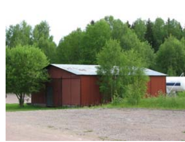
1. Lindshamar. 2. Skruv 3. Johansfors 4. Orrefors 5. Åfors ca 1930, plan fylld med ved används idag som P-plats.