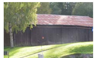
En av få bevarade vedlador i Glasriket.