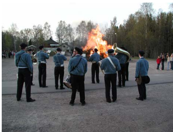
1. Musikhuset i Kosta 2. Johansfors musikkår, valborgsmässoafton vid Folkets Hus