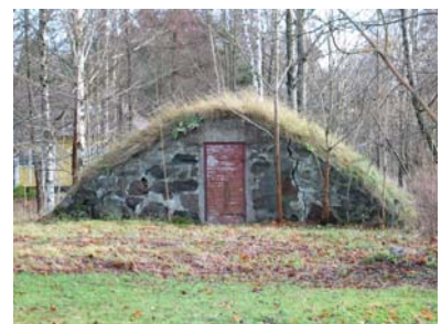
1-3 Orrefors stationsmiljö