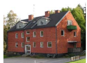
Brukets arbetarbostad från 1950- talet, inrymde ursprungligen också Konsumaffär.