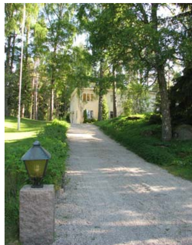
4. Åfors 5-6 Strömbergshyttan