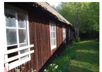
Packbod, magasin mm