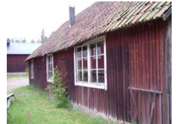
Gamla sliperiet rymmer kunskap om arbetsförhållandena förr.

Om dessa unika hus kan räddas så vidtar ett arbete med att lokalt fundera på hur dessa byggnader kan användas och leva vidare. Vi gjorde ett par försök att få kontakt med Ernst Kirchsteiger för att tipsa honom om att i sitt TV-program Sommartorpet i stället renovera en läcker industrilokal, men utan resultat. De har höga kulturhistoriska värden och är synnerligen viktiga i brukskaraktären. Förhoppningsvis kan detta arbete avancera nu i samband med att nya ägare tagit över både byggnader respektive bruk.