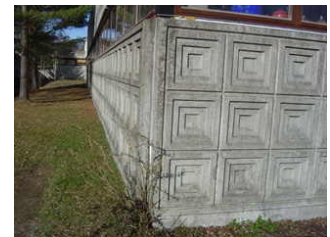
Modern arkitektur från 1950-talet