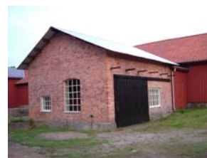
Ångmaskinhuset i Skruf är unikt.