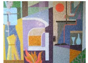
Glasmosaik från Kosta i gamla kommunhuset.