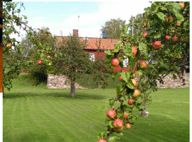
Äppelträdgården i Orrefors.