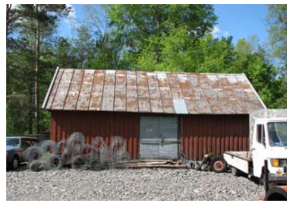
1. Lindshammars gamla spiksmedja. 2. Hammarsmedjan i Orrefors 3. Brukssmedjan i Gullaskruf