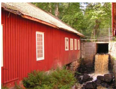
1. Johansfors 2. Lindshammar 3 Orrefors gamla kraftstation 4. Strömbergshyttan

Vattenkraftstationer på nedlagda glasbruksorter: Alsterbro (i drift), Alsterfors , ( Björkshult ), Fröseke (i drift), Idesjö , Rydefors .